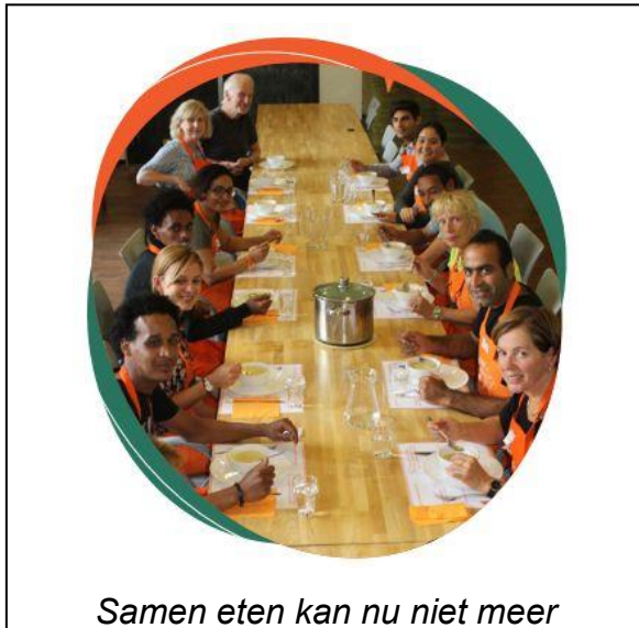
Samen eten kan nu niet meer