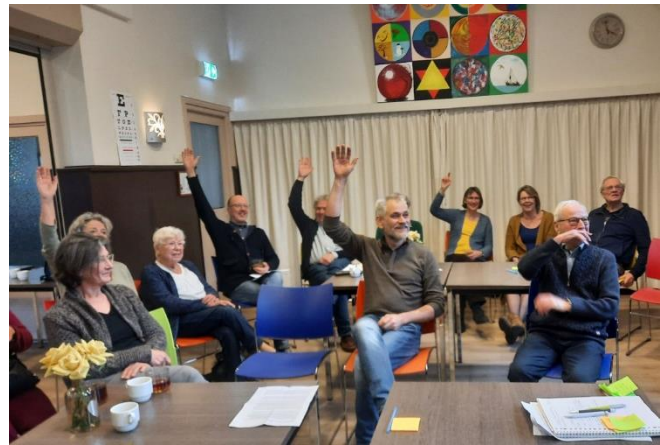
Veel instemming met de toekomstplannen

Ik vond de workshop een geslaagde stap in de richting van de uitvoering van het beleidsstuk "Reiken naar een haalbare toekomst". De Toekomstcommissie hief zich aan het einde van de middag op. Ik zag dat ze het inspirerend hadden gevonden om de afgelopen periode zo vaak bij elkaar te komen. Het lijkt me dat dit enthousiasme zeker ook zal gaan gelden voor de bijeenkomsten van de samengestelde groepjes. Trouwens: bij alle groepen is nog plaats om uit te breiden.